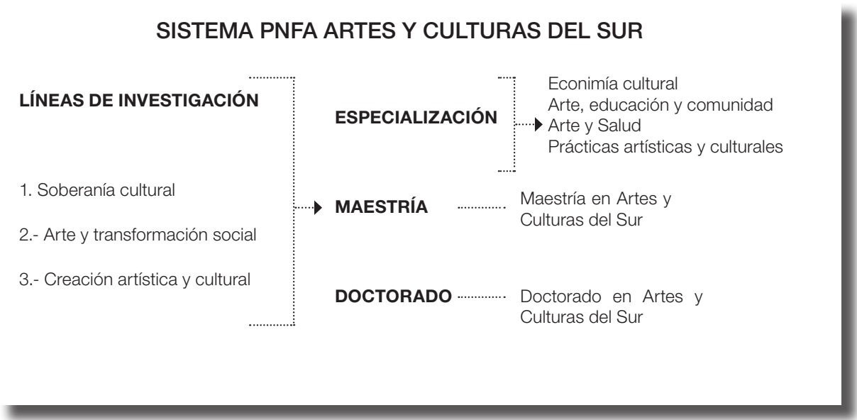
Gráfico N° 1

El gráfico N° 1 muestra a nivel general la concepción y desarrollo del Programa.